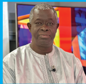
ALIOUNE DIOP : La voix du journalisme culturel P. 24