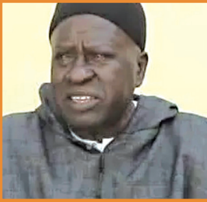
PATHÉ FALL DIÈYE : Une icône de l'audiovisuel sénégalais P. 5