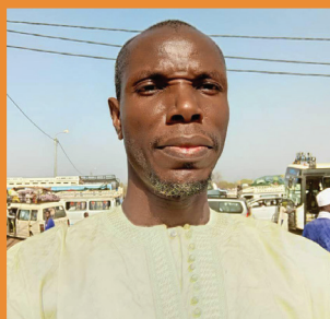
MOUSSA OUMAR GUEYE : La voix du Sénégal oriental P.31